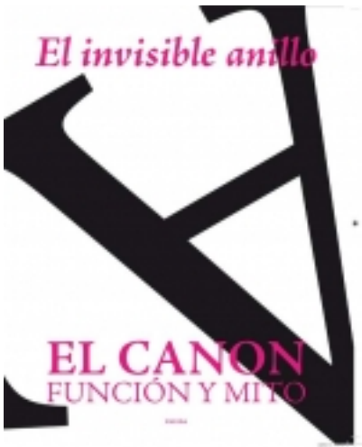
El invisible anillo. 12. Ilustrado por LUR SOTUELA 9,00 €

Resumir los contenidos de este número no es tarea sencilla, dada la diversidad y complejidad de una estructura fuerte y dinámica como la buena literatura, y que con cada lector y, por supuesto, con cada nueva lectura cobra diferentes formas y razones. A [más información ...]