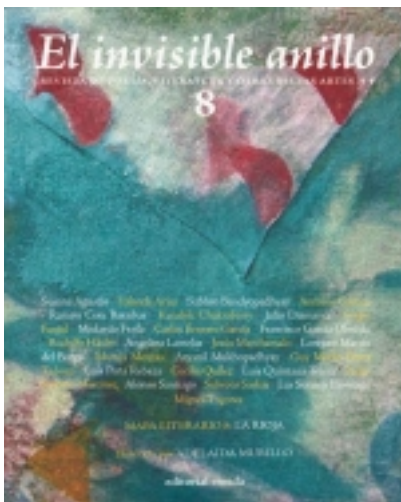
El invisible Anillo. 8. Ilustrado por ADELAIDA MURILLO 9,00 €

El extraordinario poeta venezolano JosÃ© Antonio Ramos Sucre, que, como muchos escritores del siglo pasado se suicidÃ³ ingiriendo una sobredosis de veronal, muriÃ³ en 1930 en Ginebra. En vida, su obra poÃ©tica, contenida en apenas tres libros de 346 poemas, n [mÃs informaci3n ...]